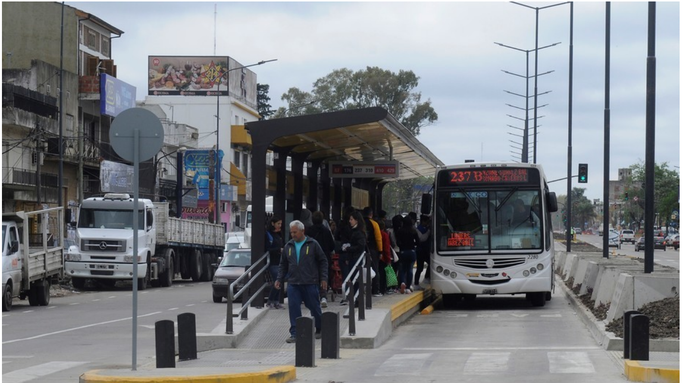
Metrobus ruta 8. Atraviesa los partidos de San Martín y Tres de Febrero.

Funciona mejor en el tramo de Tres de Febrero que en el de San Martín.