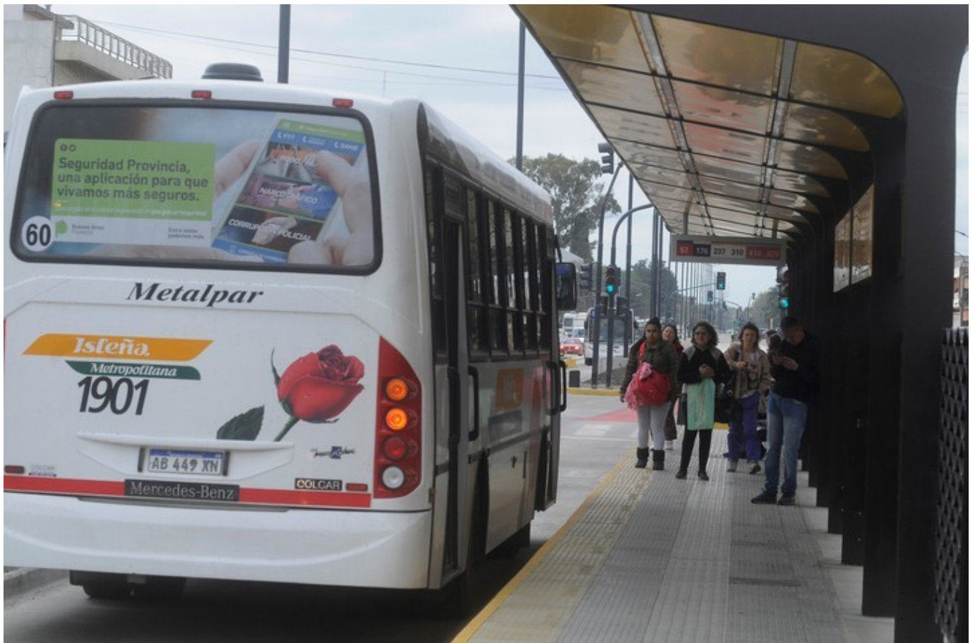
Metrobus ruta 8. Atraviesa los partidos de San Martín y Tres de Febrero.