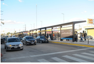
El Metrobus de La Matanza une González Catán con San Justo.

Mientras, el Metrobus de La Matanza llega hasta San Justo . Y todavía no se sabe cuándo lo extenderán a Capital. Los planes, inicialmente, era que ingresara por la General Paz y que circulara por la autopista Dellepiane hasta empalmar con el Metrobus de la 25 de Mayo.